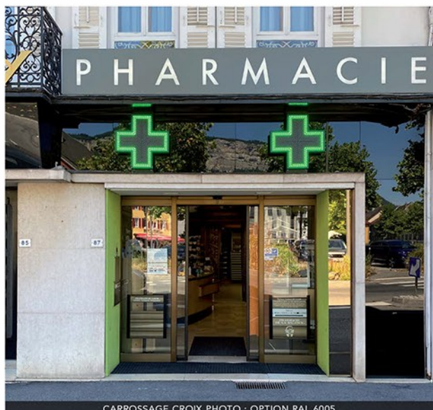
CARROSSAGE CROIX PHOTO : OPTION RAL 6005