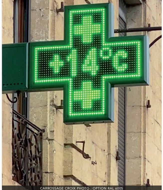
CARROSSAGE CROIX PHOTO : OPTION RAL 6005