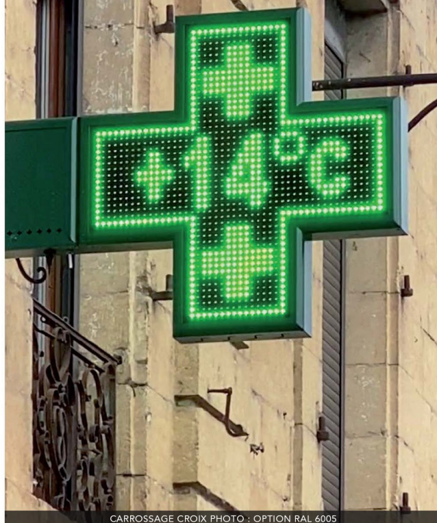
CARROSSAGE CROIX PHOTO : OPTION RAL 6005